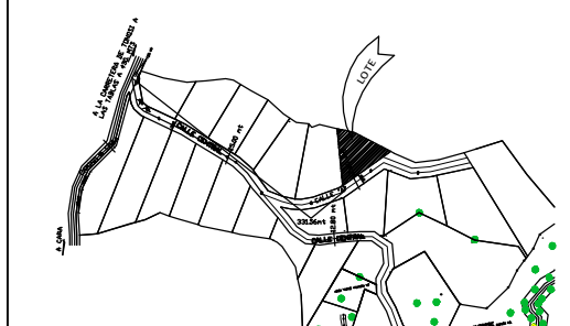
DETALLE DE AMARRE ESCALA 1:5,000