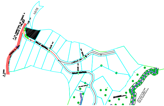
DETALLE DE AMARRE ESCALA 1:5,000