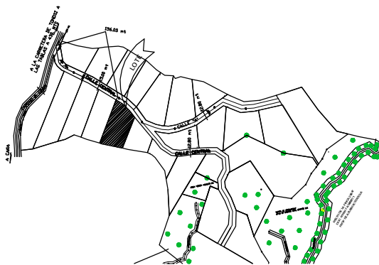
DETALLE DE AMARRE ESCALA 1:5,000